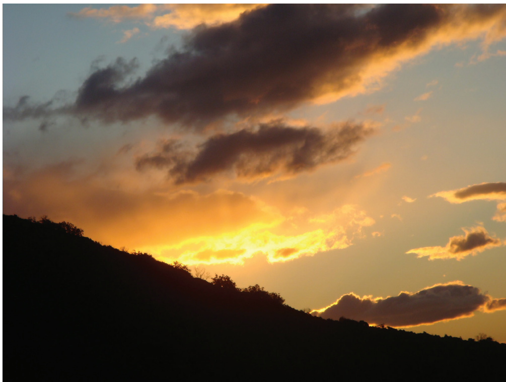
Cik zore (Ozren - Buhovo)