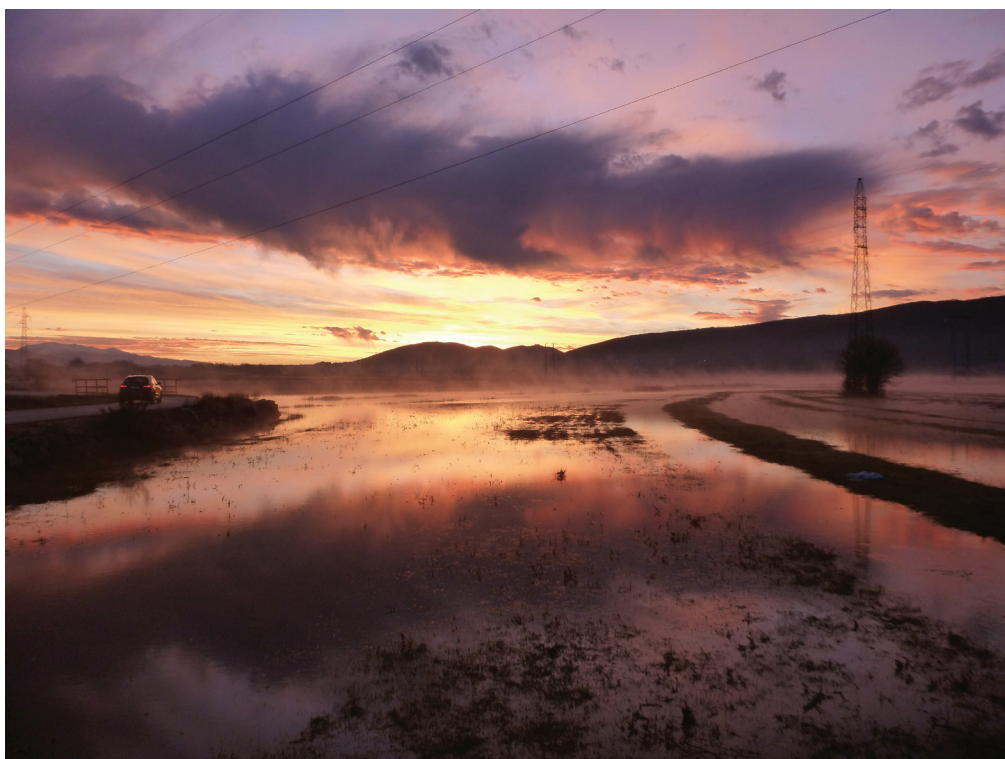
Jutarnje boje (Mostina - Kočerin)